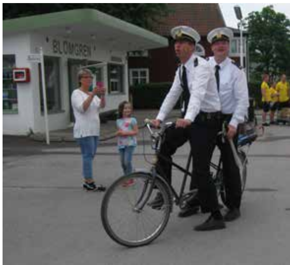
Poliserna Kling och Klang, kända från böckerna om Pippi Långstrump.

Resenärrna tog plats i fyra minibussar och en färdtjänstbil. De startade ganska tidigt, för målet var att komma fram till klockan tio, då parken öppnade.